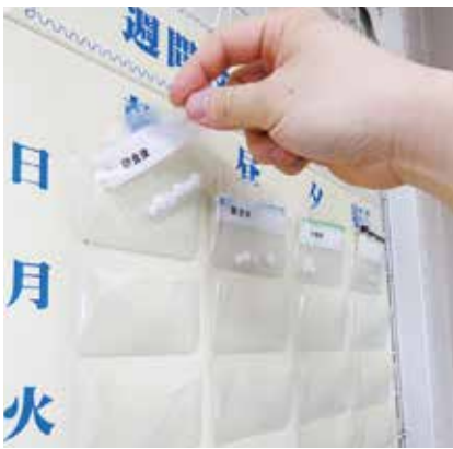
※店舗により取扱商品が異なります

薬を飲むタイミング(朝・昼・夕・寝る前)ごとに薬剤を入れて準備しておき、順番に飲んでいくと飲み間違いや飲み忘れの防止に繋がるといいうアイテムです。壁掛けタイプ他、ボックスタイプ等があります。詳しくは薬局の窓口でお問い合わせ下さい。